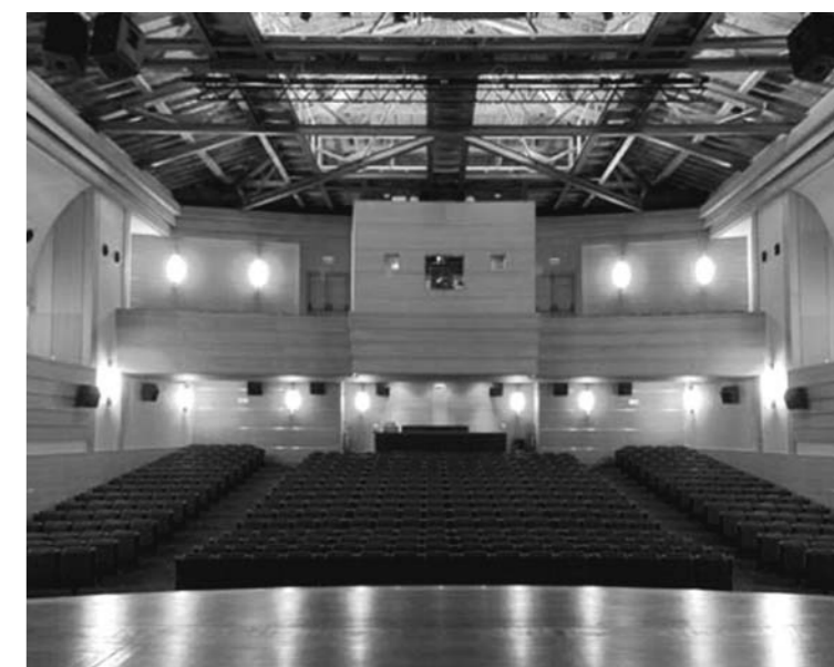
Auditório do Ramo Grande