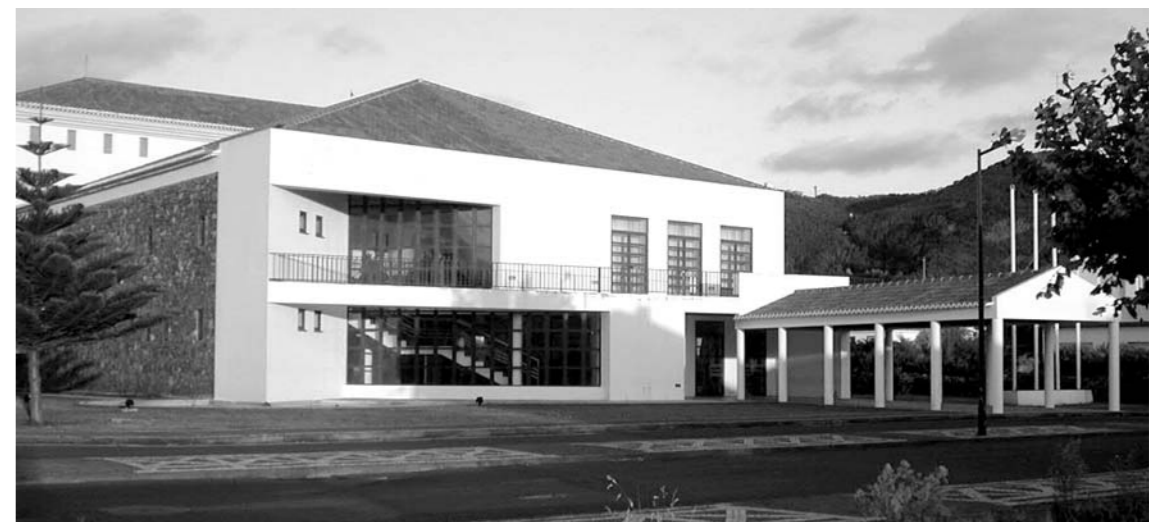
Centro Cultural da Ilha Graciosa

cidade para 260 lugares sentados é normalmente utilizado para a projecção de filmes, concertos e teatro. Com uma ampla zona de palco, com 15 metros de altura, e uma caixa de ressonância pensada para concertos acústicos e teatro, tem uma boca de cena de 12 metros e 120 metros quadrados de área total. A área técnica está equipada com uma carpintaria, cabine de luz e som, cabine de projecção e uma cabine para bombeiros. Tem também uma zona com camarins duplos, uma sala de convívio e uma sala de adereços. O fosso de orquestra