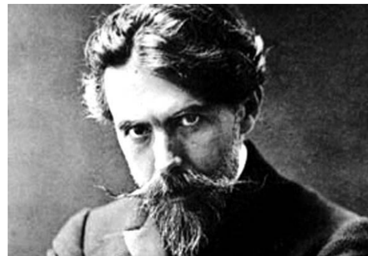
Francisco de Lacerda

Obra principal: música de cena para L'intruse , de Maurice Maeterlinck, os poemas sinfónicos intitulados «Almourôl» e «Alcácer», música de bailados, Trovas , para voz e piano (algumas das quais também para voz e orquestra), Trente-six heures pour amuser les enfants d'un artiste , para piano, e outras peças para este instrumento e para órgão.