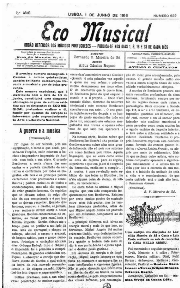
Primeira página do periódico Eco Musical