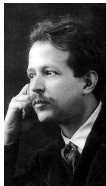
José Viana da Mota

Nome: José Viana da Mota Nascimento: São Tomé, 22 de Abril de 1868 Morte: Lisboa, 1 de Junho de 1948