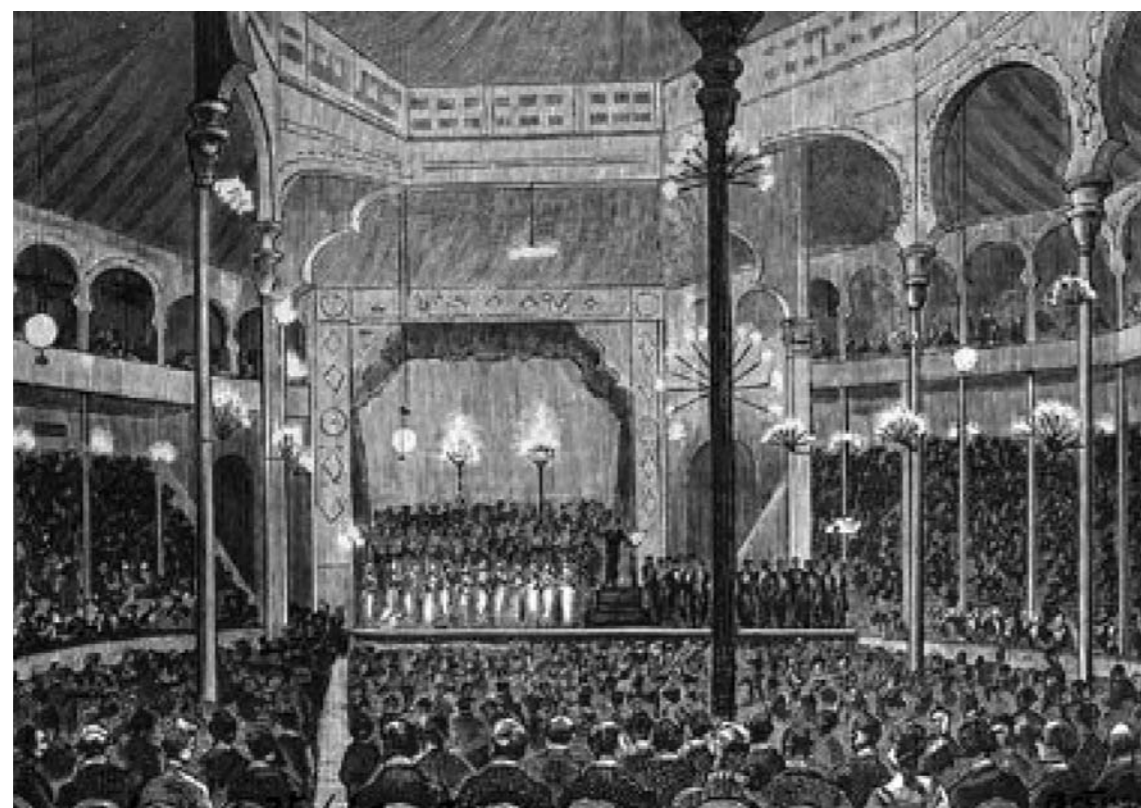
Coliseu dos Recreios em Lisboa