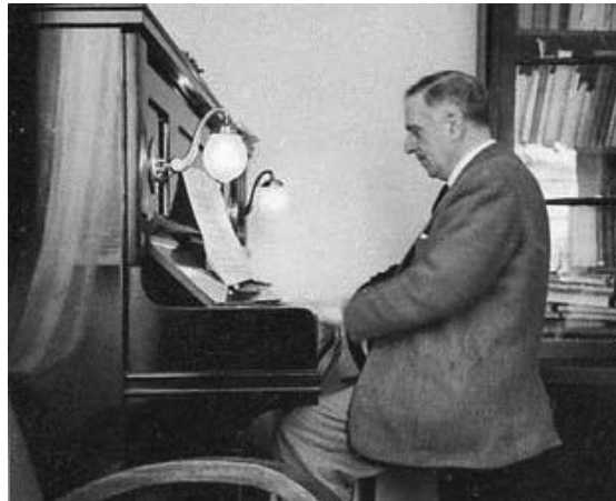
Luís de Freitas Branco

Nome: Luís de Freitas Branco Nascimento: Lisboa, 12 de Outubro de 1890 Morte: Lisboa, 27 de Novembro de 1955