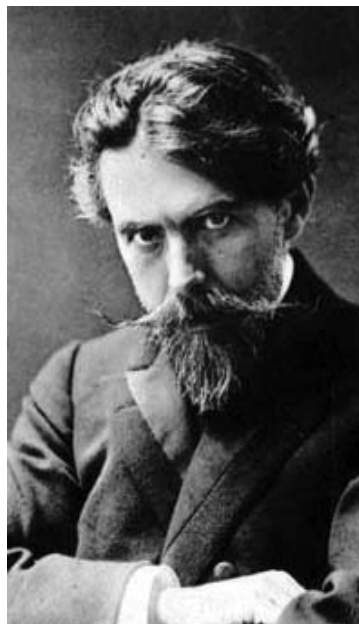
Francisco de Lacerda

José Viana da Mota. Paralelamente às suas actividades de compositor e de pedagogo, importa ainda referir que foi um importante crítico musical e um produtivo musicógrafo, neste último domínio autor de vários títulos hoje completamente esgotados. ♦