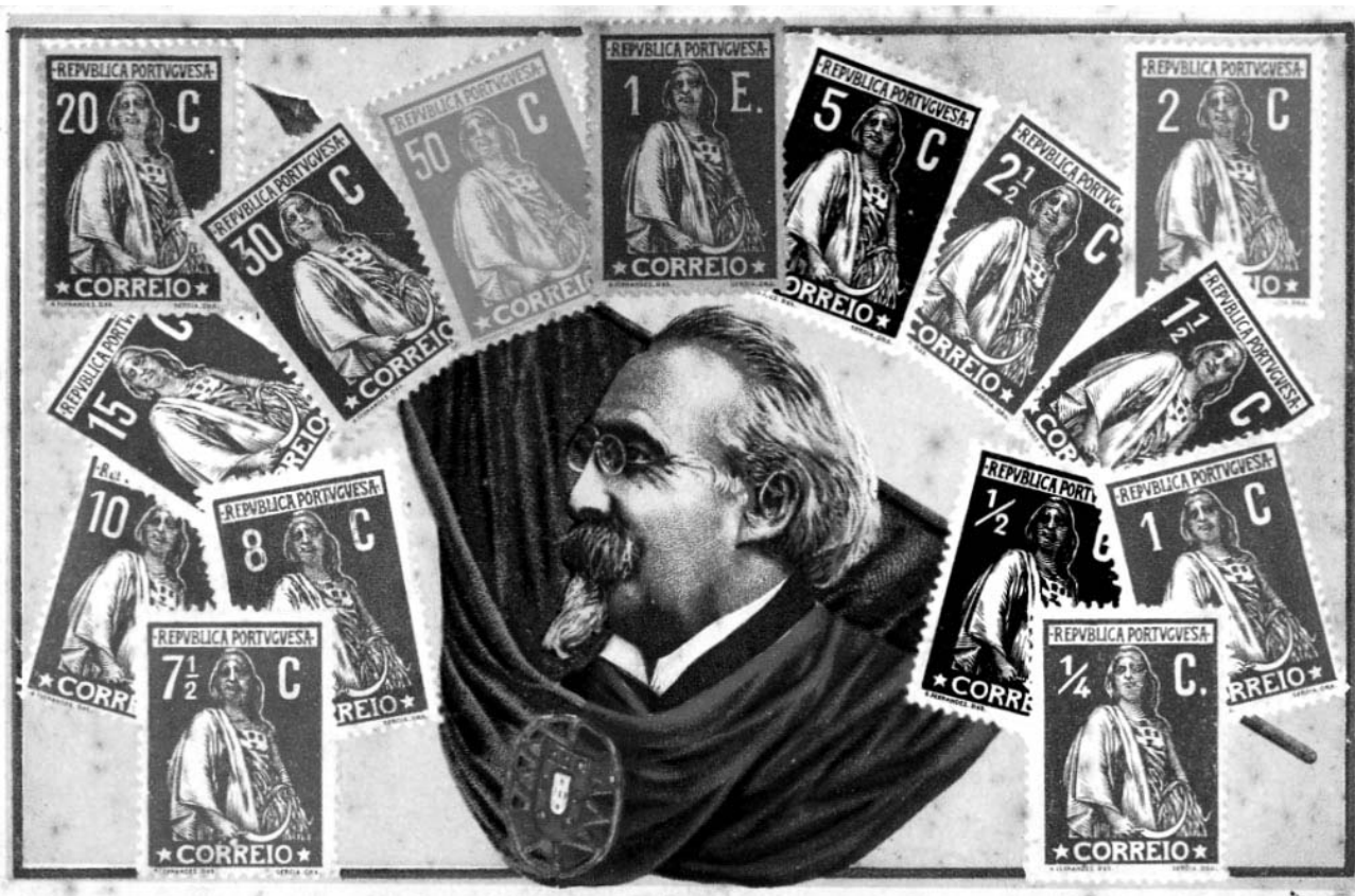
Postal representando Manuel de Arriaga (1840-1917) Presidente da República de 1911 a 1915

No domínio da ópera, novas correntes estéticas fizeram a sua entrada em Portugal, colocando num plano secundário as da década anterior, em particular as dos compositores franceses e italianos mais conhecidos do público. Dessas novas correntes, destacaram-se as óperas dos compositores ditos veristas, como Puccini, Mascagni, Leoncavallo, quer nas óperas representadas no Teatro S. Carlos, quer em concertos vocais e instrumentais. Também a obra de Wagner conheceu uma grande divulgação neste período com a representação de várias das suas ópe-