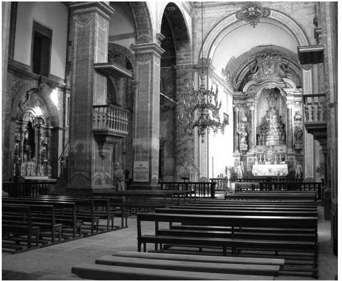
Igreja de Nossa Senhora da Guia